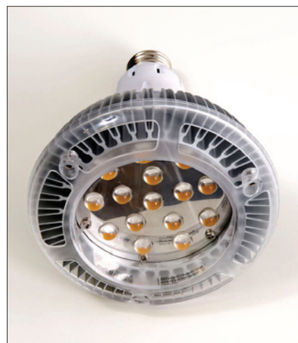
Obr. 6. Reflektorový LED zdroj (LED spot) LightDec

mohou investovat do nemovitosti ani jim není povoleno financování od vedení firmy.