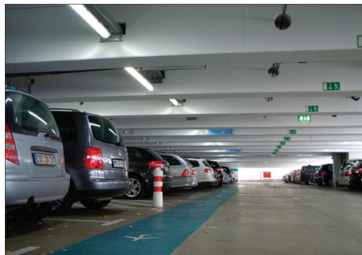
Obr. 2. Osvětlení garáže mnichovského letiště; zde výrobky značky LightDec vyhrály veřejnou soutěž z celkového počtu třinácti nabídek

„Využití našich výrobků je velice různorodé. Jsme schopni osvětlit vše od kanceláří, obchodů, nemocnic, přes parkovací garáže a výrobní haly až po reklamní plochy, benzinové stanice a komunikace,“ říká Andre Heinlein, ředitel firmy Apollo LED.