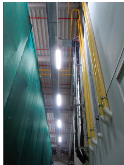
Obr. 3. Testování trubcových LED zdrojů LightDec s reflektorem s úhlem poloviční svítivosti 70° z výšky 10 m v logistické hale, zde byla naměřena o 30 % větší intenzita osvětlení

Jinou předností těchto světelných zdrojů je jejich nerozbitnost a bezpečnost, neboť neobsahují křehká vlákna (elektrody), toxické plyny nebo sklo (trubice jsou z plastu), a proto jsou zdravotně zcela nezávadné. Vydrží častou frekvenci zapínání a vypínání a zároveň jsou vhodné k dlouhodobému svícení.