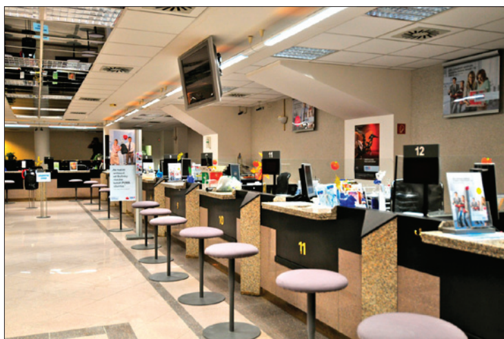
Obr. 1. Pobočka České spořitelny osvětlená trubcovými LED zdroji; zde je potvrzeno, že za dobu měření byla spotřeba elektrické energie o 58 % nižší a zaměstnanci banky jsou se světlem spokojeni

Produkty LightDec mají veškeré certifikáty požadované EU od TÜV Rheinland Group a jsou kompatibilní se standardními kolíkovými patičkami G13. Trubcové LED zdroje LightDec jsou prvním výrobkem, který získal certifikát VDE. Tyto výrobky mají pojištění odpovědnosti u Lloyd London a záruka na ně je 30 měsíců.