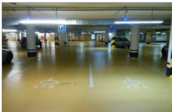
Obr. 5. Porovnání osvětlení zářivkami (vlevo) a trubcovými LED zdroji LightDec (vpravo)