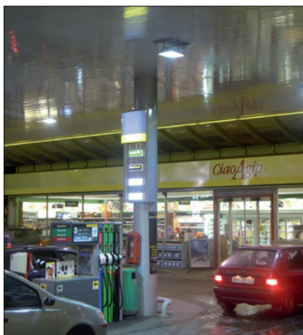
Obr. 2. Využití svítidla A4-H4-50° u benzinové čerpací stanice Agip

prostředí je možné s uvedenými svítidly ušetřit až 80 % energie, a proto je dosaženo velmi krátké doby návratnosti vložených nákladů.